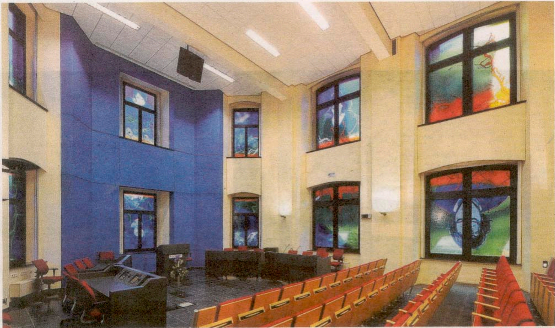
Enkele delen van het glazen kunstproject van de Eindhovense kunstenaar Gery Bouw in de universiteit van Maastricht.