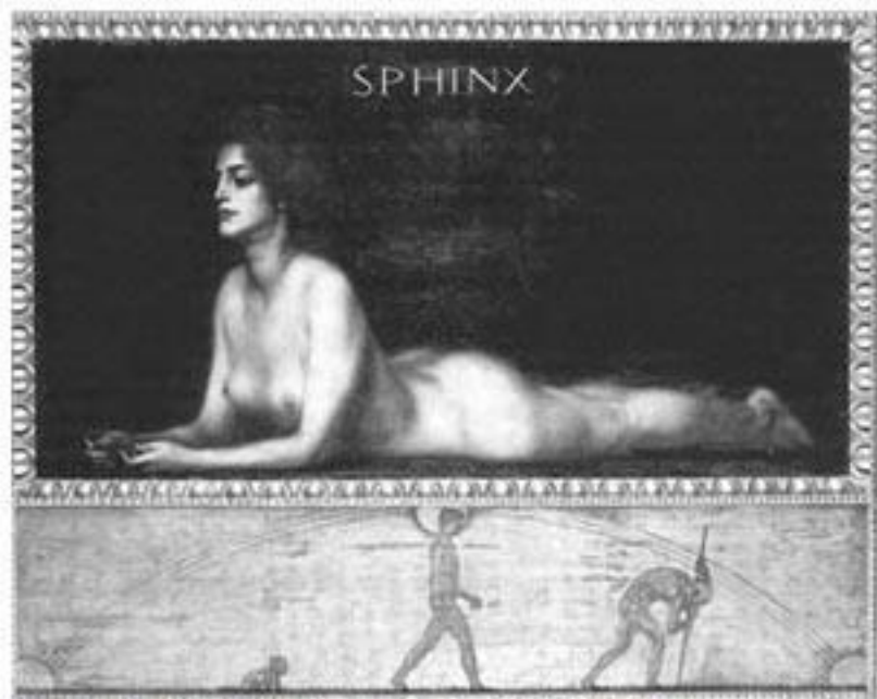
Franz von Stuck, Sphinx , 1901, olieverf op doek, 78,7x152,4 cm privé collectie (herkomst foto onbekend).

De kunstenaars hebben een eigen idioom ontwikkeld om aan dit thema beeldend inhoud en vorm te geven. In onder meer de westerse Europese kunst zien we daar vanaf de Middeleeuwen diverse voorbeelden van. Dat lange tijd daarbij de christelijke levensvisie met de overtuiging dat na dit aardse leven het hiernamaals wacht, centraal staat, mag vanzelfsprekend zijn. De levenscyclus van de mens werd, naast de eerder genoemde drie fasen, nog in meerdere verdeeld. Zo wordt de levensloop van de mens verbonden met het voortschrijdende jaar, waarbij vier levenstijdperken met de vier jaargetijden corresponderen, of twaalf levensfasen met de twaalf maanden. Zes levensstadia worden gekoppeld aan de zes tijdperken van de geschiedenis, terwijl zeven verbonden zijn aan de zeven planeten.