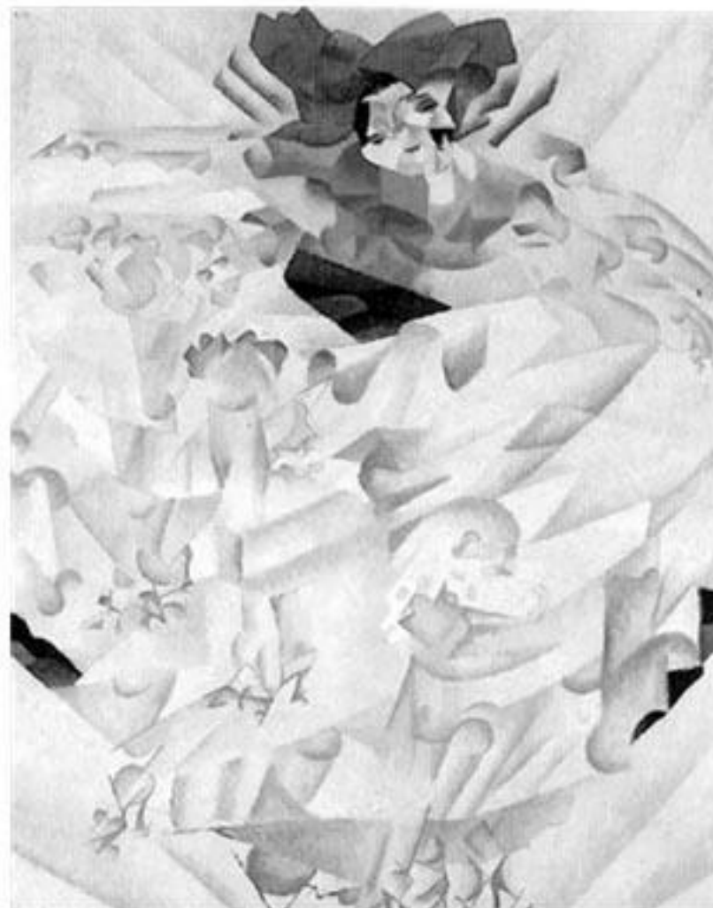
Gino Severini, Dinamismo di una danzatrice , 1912, olieverf op doek, 60x45 cm, privé collectie (herkomst foto onbekend).