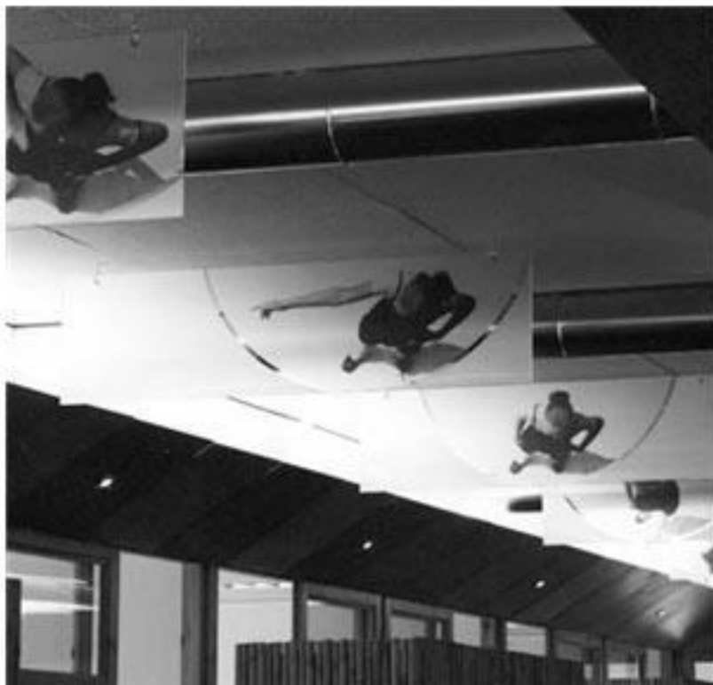
Raad van Kinderbescherming, Arnhem, 1999