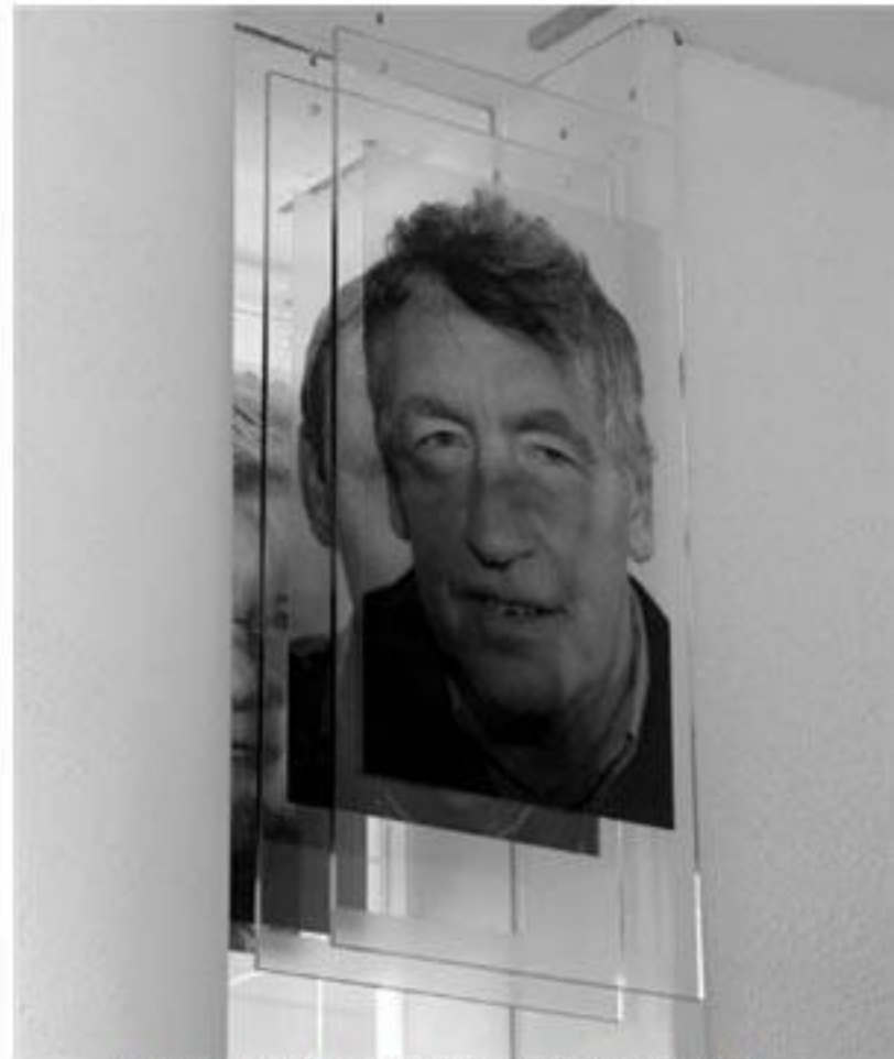
Kulturhus, Zwartsluis, lokale omroep/kinderopvang, detail